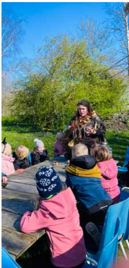
AFBEELDING 2: NATUURTHEATER 2023