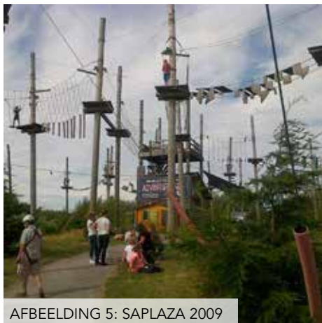
AFBEELDING 5: SAPLAZA 2009