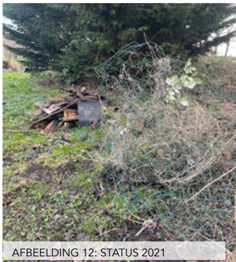
AFBEELDING 12: STATUS 2021