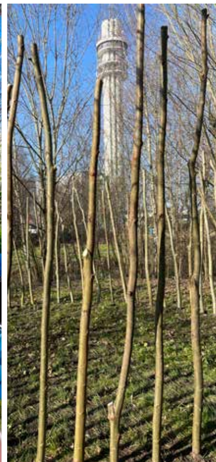
AFBEELDING 3: HEKSENKRING 2023