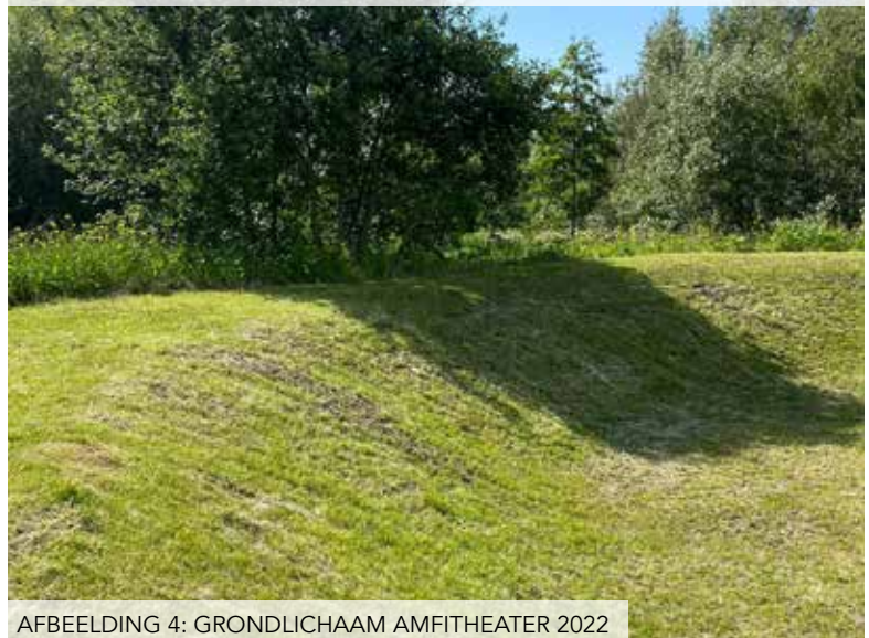
AFBEELDING 4: GRONDLICHAAM AMFITHEATER 2022