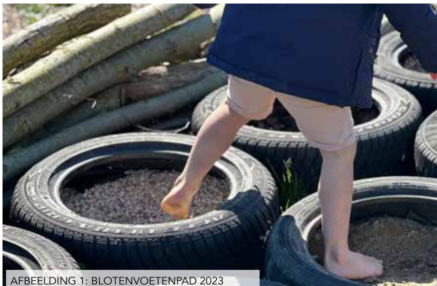
AFBEELDING 1: BLOTENVOETENPAD 2023

Het eiland van het Veer draagt bij aan de leefbaarheid van de stad Haarlem. Buiten spelen bevordert de geestelijke gezondheid. Voor iedereen: jong & oud.