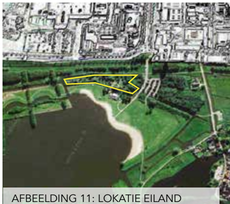
AFBEELDING 11: LOKATIE EILAND