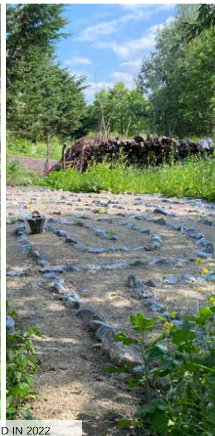
AFBEELDING 8 & 9: STATUS VAN HET EILAND IN 2022