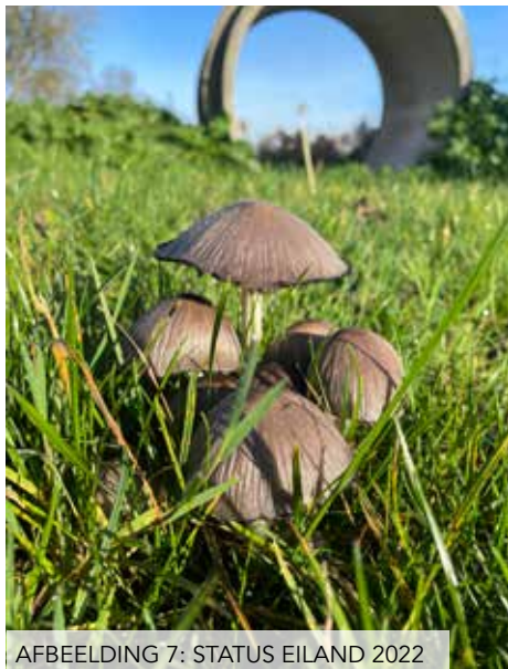
AFBEELDING 7: STATUS EILAND 2022