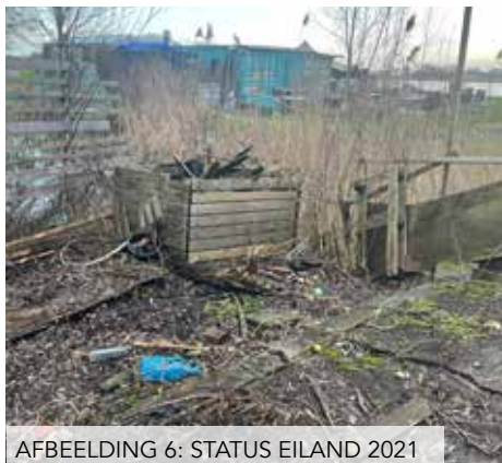
AFBEELDING 6: STATUS EILAND 2021

OKTOBER 2021 Bevestiging van gemeente Haarlem dat de vergunningaanvraag compleet is